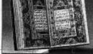
(See P. 16)