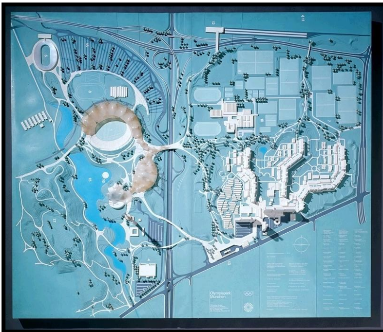
9. Modell des Olympiaparks München