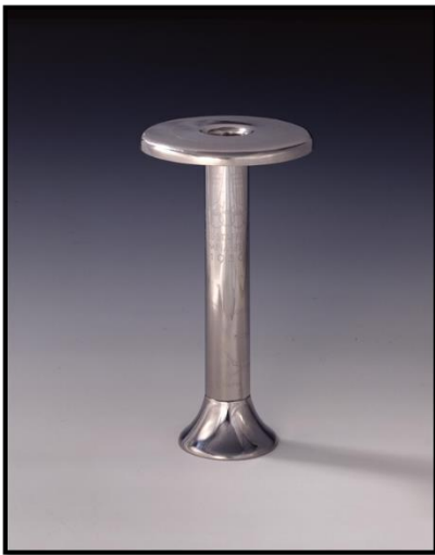
4. Fackelhalter vom Fackellauf der Olympischen Spiele Berlin 1936