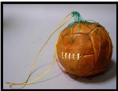
5. Fußball mit Unterschriften deutscher Nationalspieler von 1954 und 1958