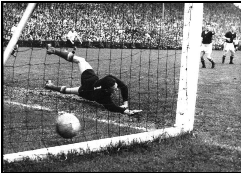
6. Helmut Rahn schießt das Entscheidungstor im Endspiel gegen Ungarn bei der Fußballweltmeisterschaft 1954