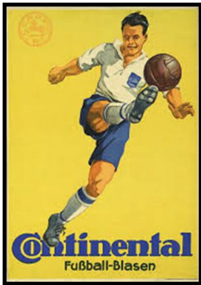
3. Werbeplakat für Fußball-Blasen der Firma "Continental" 1920er