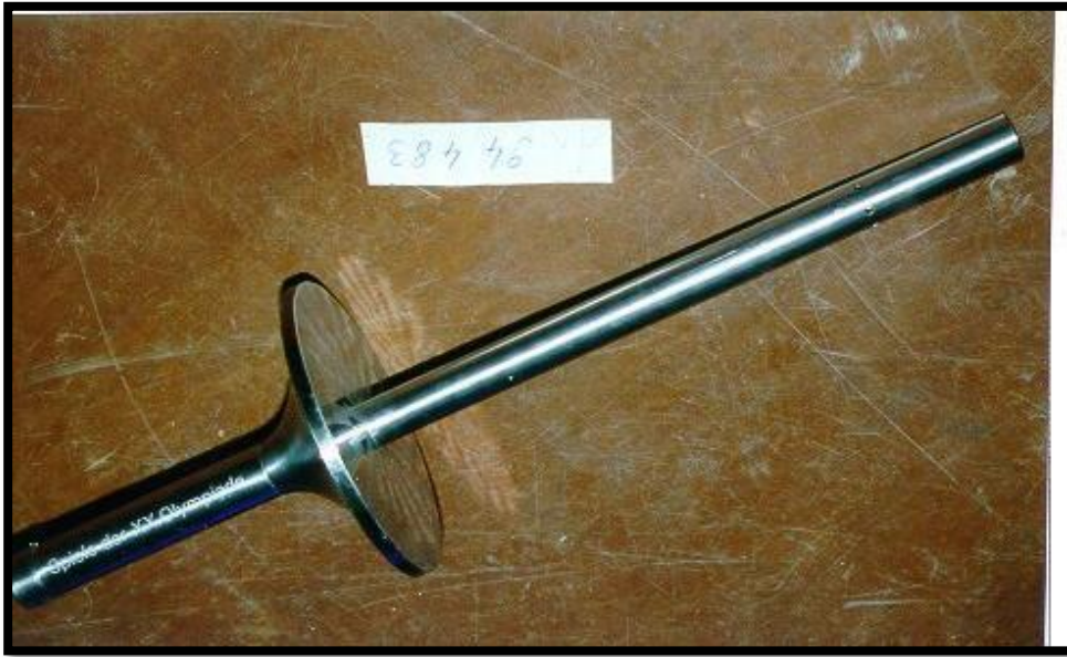
7. Fackel vom Staffellauf des Olympischen Feuers von Olympia nach München 1972