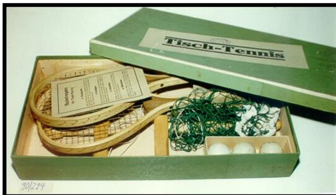
2. Tisch-Tennis Set 1920er