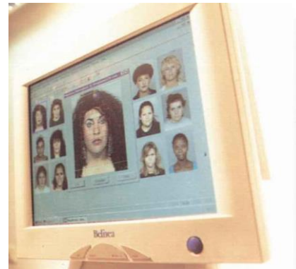
Die Forschungen von Christoph von der Malsburg konzentrieren sich auf die Frage, wie das visuelle System heranreift, wie die einzelnen Nervenzellen zusammenarbeiten um beispielsweise ein Gesicht zu erkennen und wie man einem Computer diese Fähigkeit beibringen kann.

Auch wenn das Auge eine Figur vom Hintergrund lösen soll, spielt die zeitliche Bindung eine Rolle. Um die Figur zu identifizieren, muss der Wahrnehmungsapparat sie in ihre verschiedenen Einzelteile zerlegen – segmentieren wie der Fachmann sagt: Etwa in Bewegung, Stereotiefe, Textur, Farbe oder Objektkanten. Zunächst wurde vermutet, dass die Nervenzellen, die das Objekt repräsentieren, aktiv sind, während die Zellen, die den Hintergrund abbilden, still bleiben – das Objekt sollte also quasi vor dem Hintergrund aufleuchten. Doch dann stellte sich heraus, dass beide Zellgruppierungen in bestimmten Zeitintervallen aktiv sind – allerdings feuern jene für den Hintergrund jeweils »im Tritt« und jene, die das Objekt repräsentieren, feuern ebenfalls synchron,